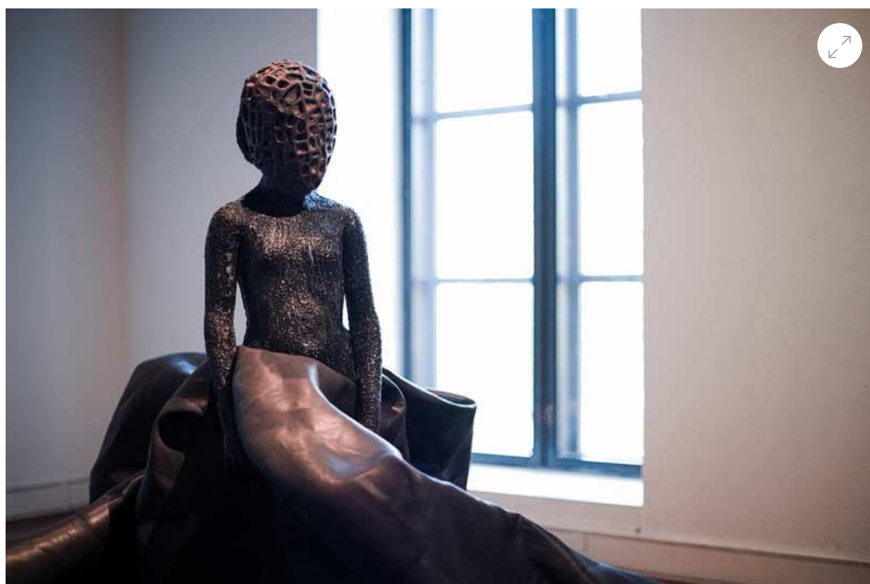
Petri Haavisto: Takeover, 2020, pronssi, trampoliinin matto, musta 3D-filamentti, koko 182 x 125 x 129 cm. AKU KOSKINEN